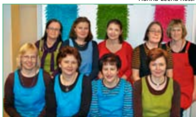
Satakunnan taitokeskusten neuvojat

Julkaisija: Satakunnan käsi- ja taide-teollisuus ry Osoite: Marttilankatu 10, 38200 SASTAMALA puh. (03) 5113597 Päätoimittaja: Hanna-Leena Rossi Toimituskunta: Riitta Eeronheimo ja Satu Ojala Sivunvalmistus ja taitto: Huittisten Sanomalehti Oy Painopaikka: Westpoint, Rauma