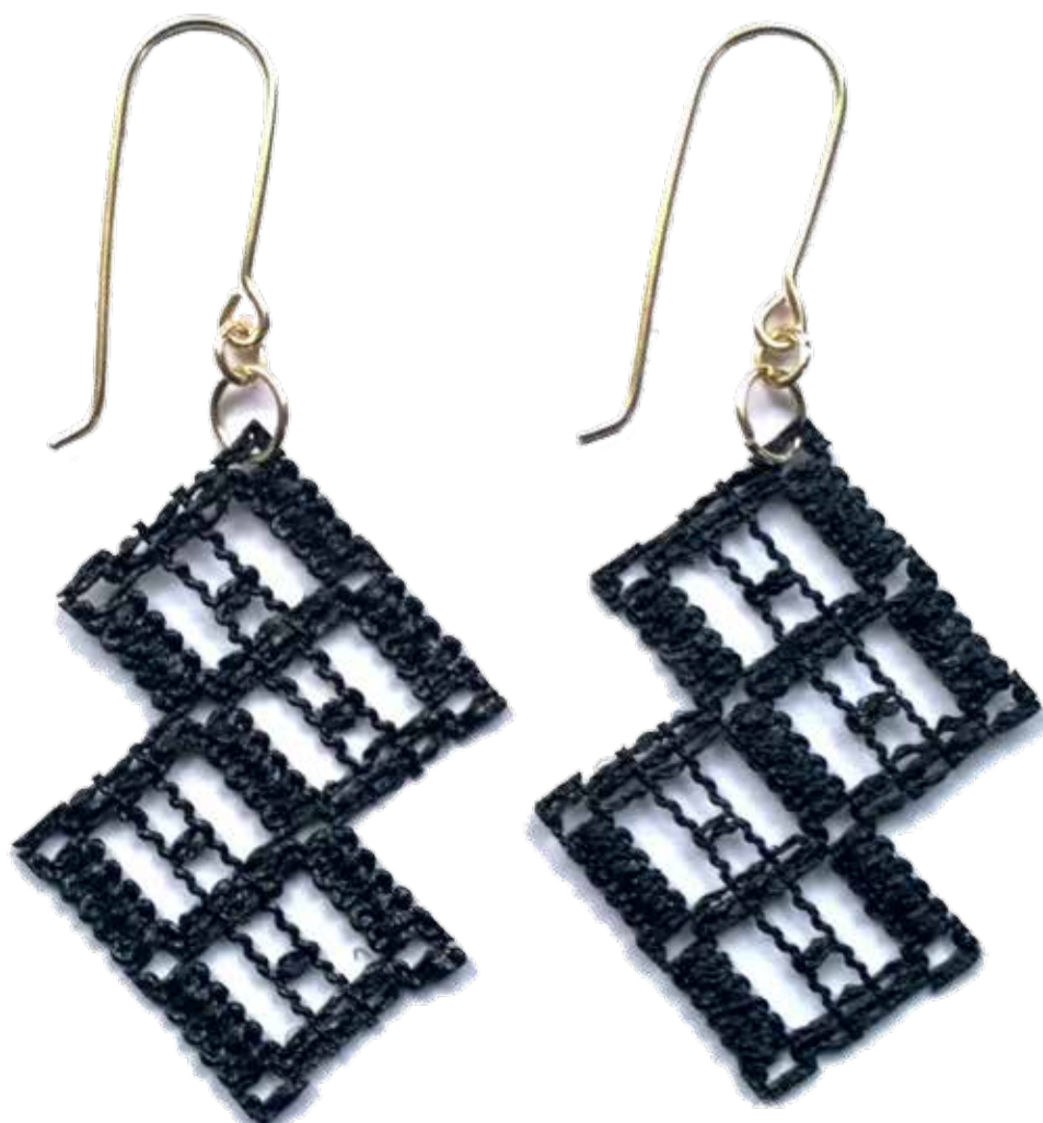
Tiia Kirjavaisen näkemyks Kasin ratikasta.

Myös monet käsityöyrittäjät ovat innostuneet pitsistä tai pitsinomaisista tuotteista.