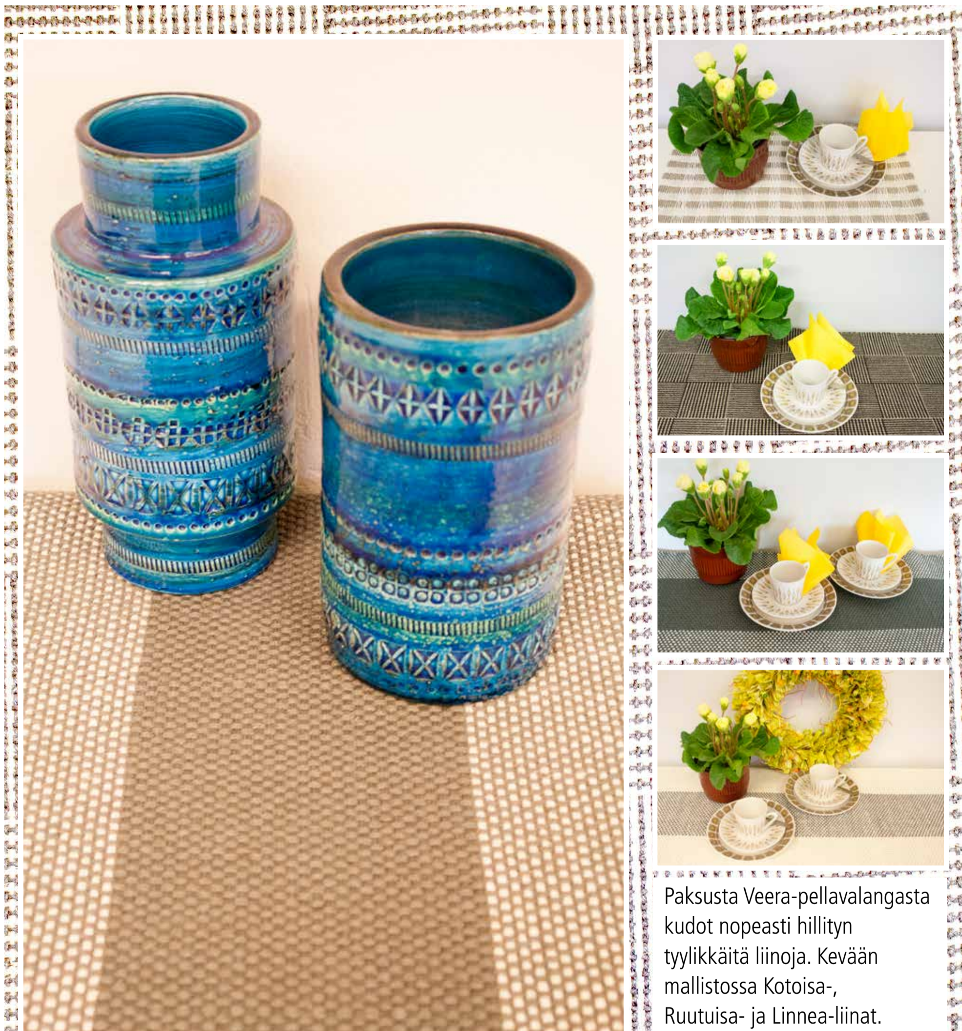
Paksusta Veera-pellavalangasta kudot nopeasti hillityn tyylikkäättä liinoja. Kevään mallistossa Kotoisa-, Ruutuisa- ja Linnea-liinat.